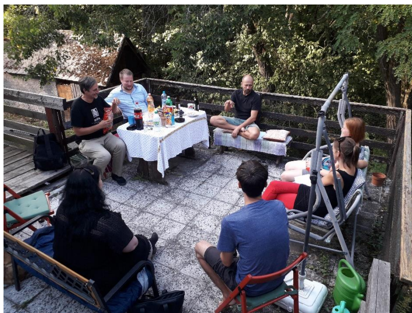
Výjezdní porada IPSI, září 2019

IPSI vydává analýzy a studie, ale také komentáře, blogy a tiskové zprávy. Zpracovává návrhy a doporučení, které nabízí jak médiím a veřejnosti, tak především konkrétním institucím ve veřejné správě. IPSI připomínkuje návrhy legislativních a systémových změn.