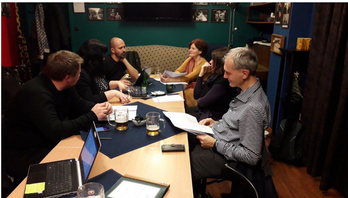
Správní rada IPSI, prosinec 2019